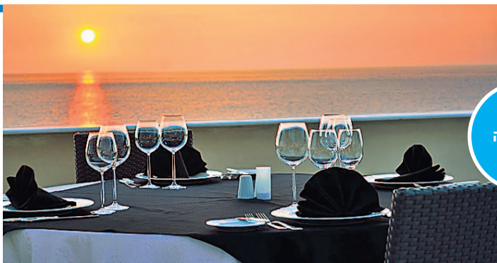
מלון גיאורגיה פלאס